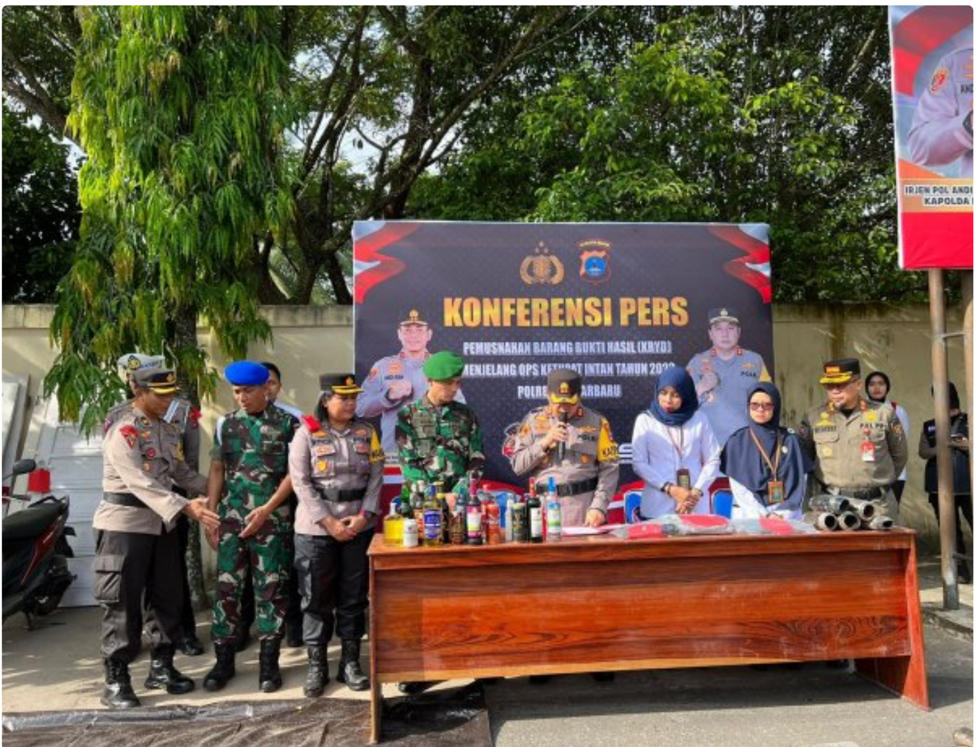
Kapolres Banjarbaru Bersama Dandim Banjar Musnahkan Ribuan Miras dan Ratusan Knalpot Brong di Kota

BANJARBARU - Ribuan minuman keras (miras) dan ratusan knalpot brong dari hasil sitaan polisi selama Ramadan, dimusnahkan di Polres Banjarbaru, Senin (17/4/2023).